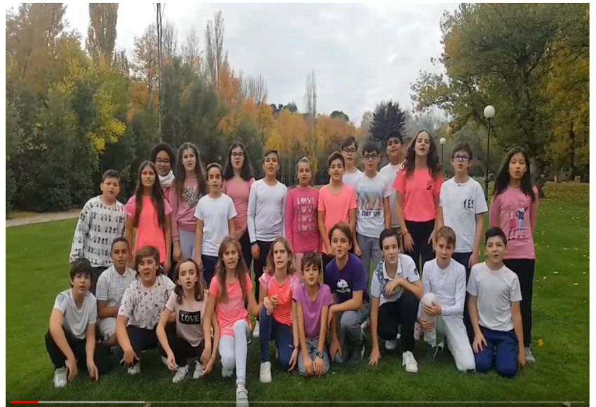
CEIP Antonio Delgado Calvete, Logroño (La Rioja) 2º premio 2018

El 25 de Noviembre se celebra el Día internacional de la Eliminación de la Violencia contra la Mujer y desde FeSP-UGT te proponemos participar en el V Concurso de audiovisuales "Ama en igualdad. Di no a la violencia".