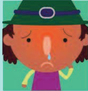
Para el catarro