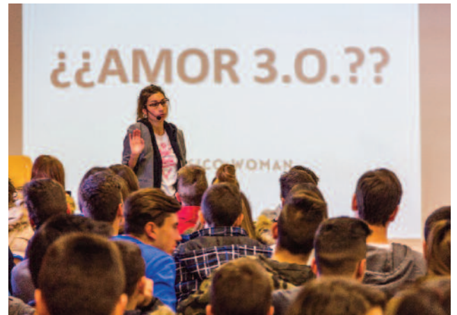
La psicowoman en una charla con adolescentes